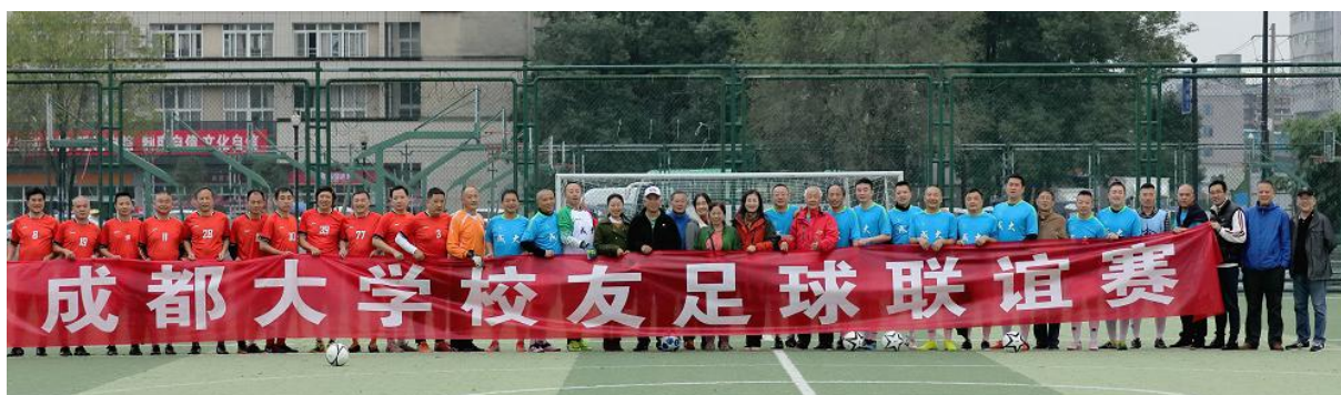
(摘编自成都大学校友网，文/徐梦婷、王奇，图/黄强、陈加周)